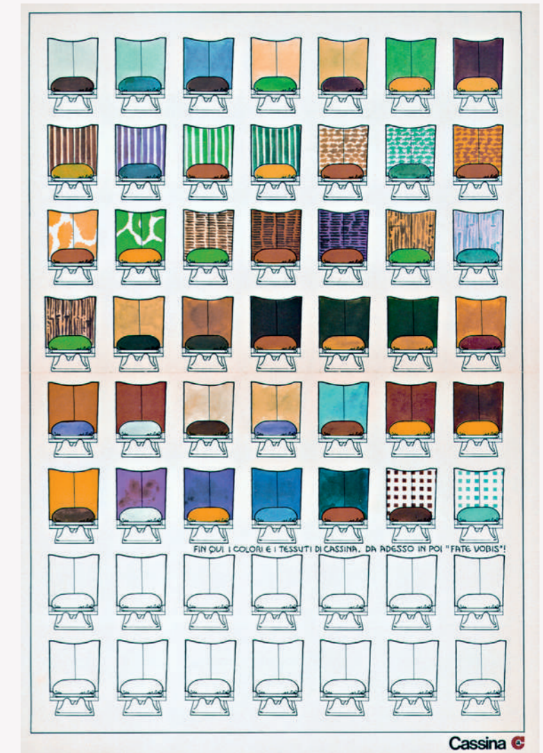
Aeo poster, 1973. Archivio storico Cassina.

Aeo est le dernier produit dessiné par Paolo Deganello avec le group Archizoom en 1973 comme une interprétation non conventionnelle du fauteuil moderne. Grâce à l'utilisation expérimentale des matériaux, le modèle a d'abord été proposé démonté afin de permettre au client de l'assembler de façon autonome. Le fauteuil était proposé dans une vaste gamme de revêtements qui, avec le concept de modularité, permettait de personnaliser librement le produit. AEO est la quintessence de la fonctionnalité et de la polyvalence des meubles Cassina, du fait qu'il combine en un seul objet de nombreuses caractéristiques telles que la démontabilité, la lavabilité, la légèreté et la commodité, qui permette de l'adapter facilement à n'importe quel environnement et style.